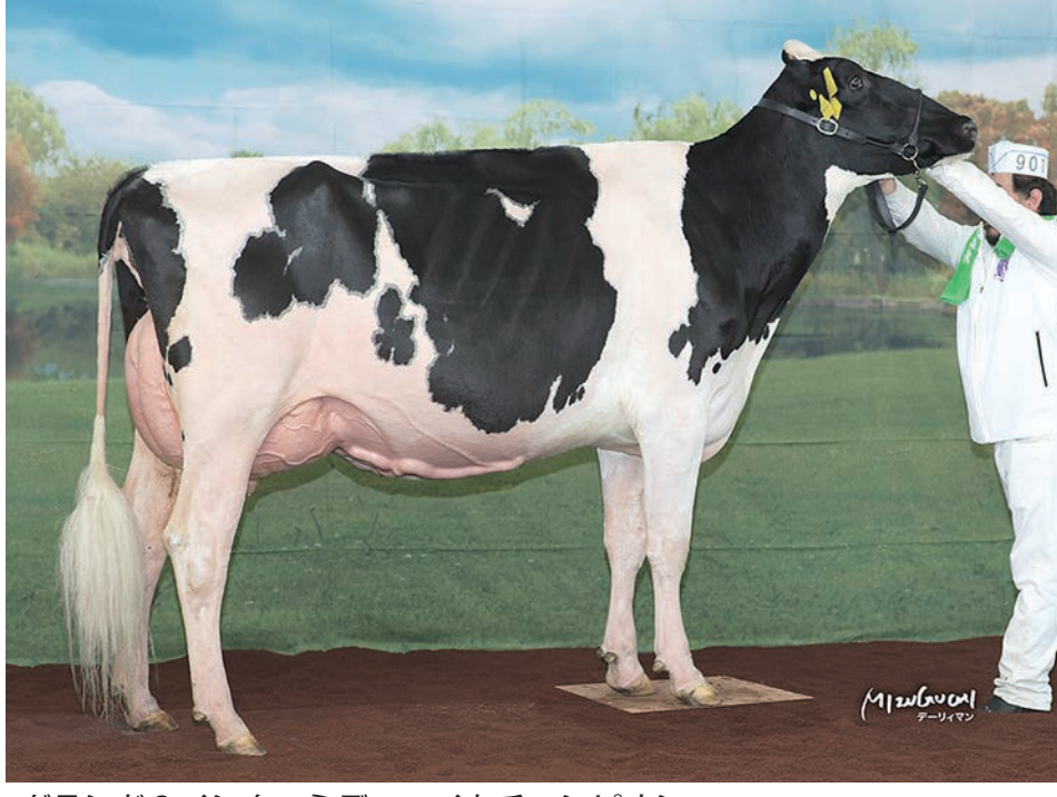
ランド&インターミディエイトチャンピオン ラブリーファーム クインジス ドアマン(父:ドアマン) 群馬県高崎市 (株)長坂牧場