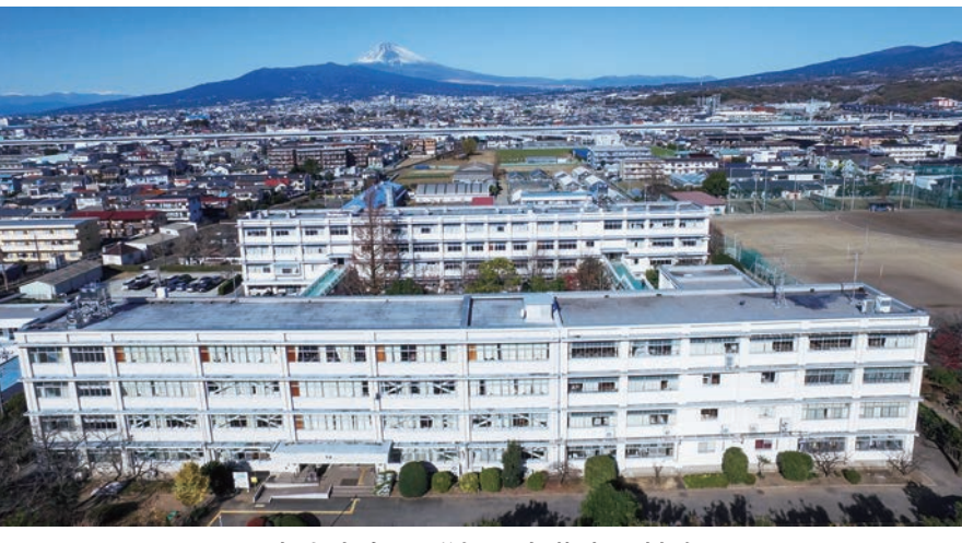
富士山をのぞむ田方農高の校舎

本校は、酪農を学ぶ動物科学科のほか、生産動物科学科・園芸デザイン科・食品科学科・ライフデザイン科の5学科で約600人の生徒が在学中です。動物科学科では、乳牛20頭前後(うち成年12頭)、犬・ポニー・ヤギ・ウツク・家畜類などを飼育しています。1年生はすべての動物の飼育を体験し、2年時に酪農を学ぶ生産動物コースか、犬などの愛玩動物や動物実験を学ぶ動物活用コースを選ばれます。