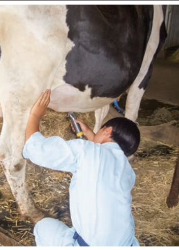
飼養牛の世話をする実習風景

本校がある田方郡函南町には丹那盆湯があり、この周辺は標高が高いため、古くから酪農が盛んで100年以上の歴史があります。本校の歴史からみても、丹那酪農の歴史は本校酪農科の前身である、畜産科の歴史でもあり、昨年開校120周年に至るまで酪農技術者を輩出してまいりました。