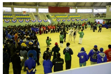
【第14回後継者育成プログラム】

事務局 (一社) 日本ホルスタイン登録協会 全共対策室 池田・國行 電話 03-3383-2501 FAX 03-3383-2503 e-mail zenkyo@hcaj.or.jp ホームページ https://hcaj.or.jp 開催地事務局 北海道ホルスタイン農業協同組合 総務部 電話 011-726-3111 FAX 011-726-3135 e-mail zenkyo_hokkaido@holstein.jp